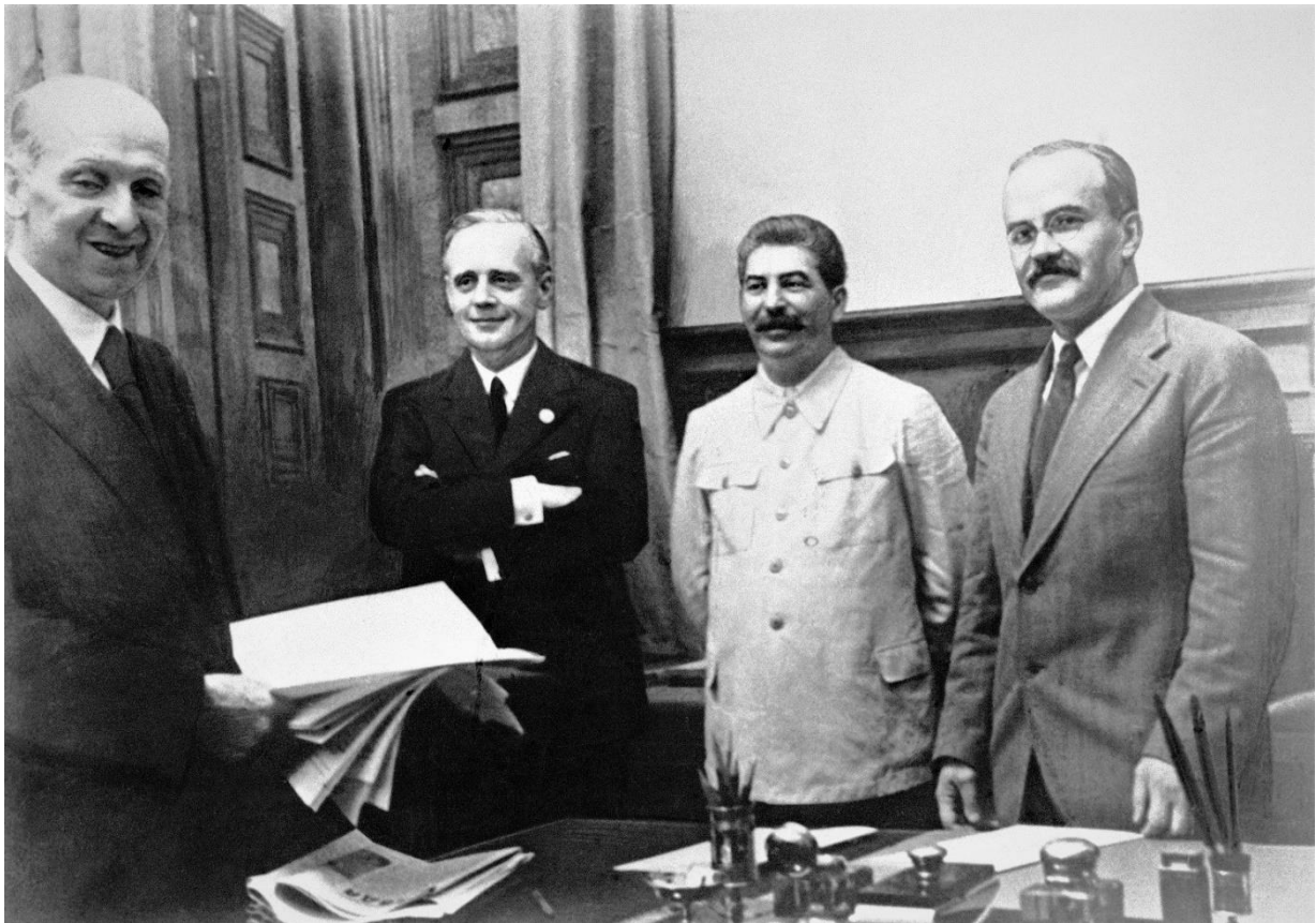
Podpisanie radziecko-niemieckiego paktu o nieagresji, Moskwa, 23.08.1939 r., [dostęp 01.09.2021]. Dostępne w Wikipedia, wolna encyklopedia: https://pl.wikipedia.org/wiki/Pakt_Ribbentrop-Mo%C5%82otow#/media/Plik:%D0%9D%D0%B0_%D0%B7%D0%B0%D0%BA%D0%BB%D1%8E%D1%87%D0%B5%D0%BD%D0%B8%D0%B8_%D1%81%D0%BE%D0%B2%D0%B5%D1%82%D1%81%D0%BA%D0%BE-%D0%B3%D0%B5%D1%80%D0%BC%D0%B0%D0%BD%D1%81%D0%BA%D0%BE%D0%B3%D0%BE_%D0%B4%D0%BE%D0%B3%D0%BE%D0%B2%D0%BE%D1%80%D0%B0_%D0%BE_%D0%BD%D0%B5%D0%BD%D0%B0%D0%BF%D0%B0%D0%B4%D0%B5%D0%BD%D0%B8%D0%B8.jpg