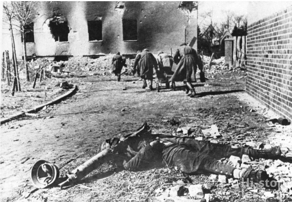
↑ Pouličné boje počas obliehania Leningradu, 1943.

V prieskume verejnej mienky z roku 2018 81 % Rusov uviedlo, že ich rodinní príslušníci sa zúčastnili na „Veľkej vlasteneckej vojne“, ako sa v Rusku nazýva vojna ZSSR proti Nemecku a jeho spojencom v rokoch 1941 až 1945, a 58 % z nich dodalo, že počas vojny stratili niekoho blízkeho.