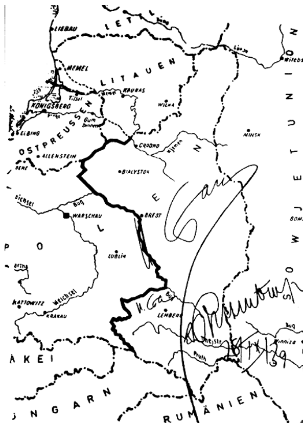
Mapa z nemecko-sovietskej zmluvy o priateľstve, spolupráci a demarkačnej línií, 28. 9. 1939 [prístup 12. marca 2021]. Dostupné na Wikipédii, slobodnej encyklopédii: https://pl.wikipedia.org/wiki/Plik:Mapa_2_paktu_Molotov-Ribbentrop-Mo%C5%82otow.gif

Mapa pripojená k paktu Molotov-Ribbentrop, ktorá rozdeľuje Poľsko na nemeckú a sovietsku okupačnú zónu (28. septembra 1939). Podpísali ju Josif Stalin a Joachim von Ribbentrop. Obsahuje aj opravy hraníc, ktoré osobne vykonal samotný Stalin.