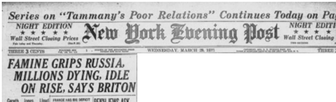
Obr. č. 1: Úryvok z novín New York Evening Post z 29. marca 1933

Správa o tlačovej konferencii Garetha Jonesa publikovaná v novinách New York Evening Post 29. marca 1933