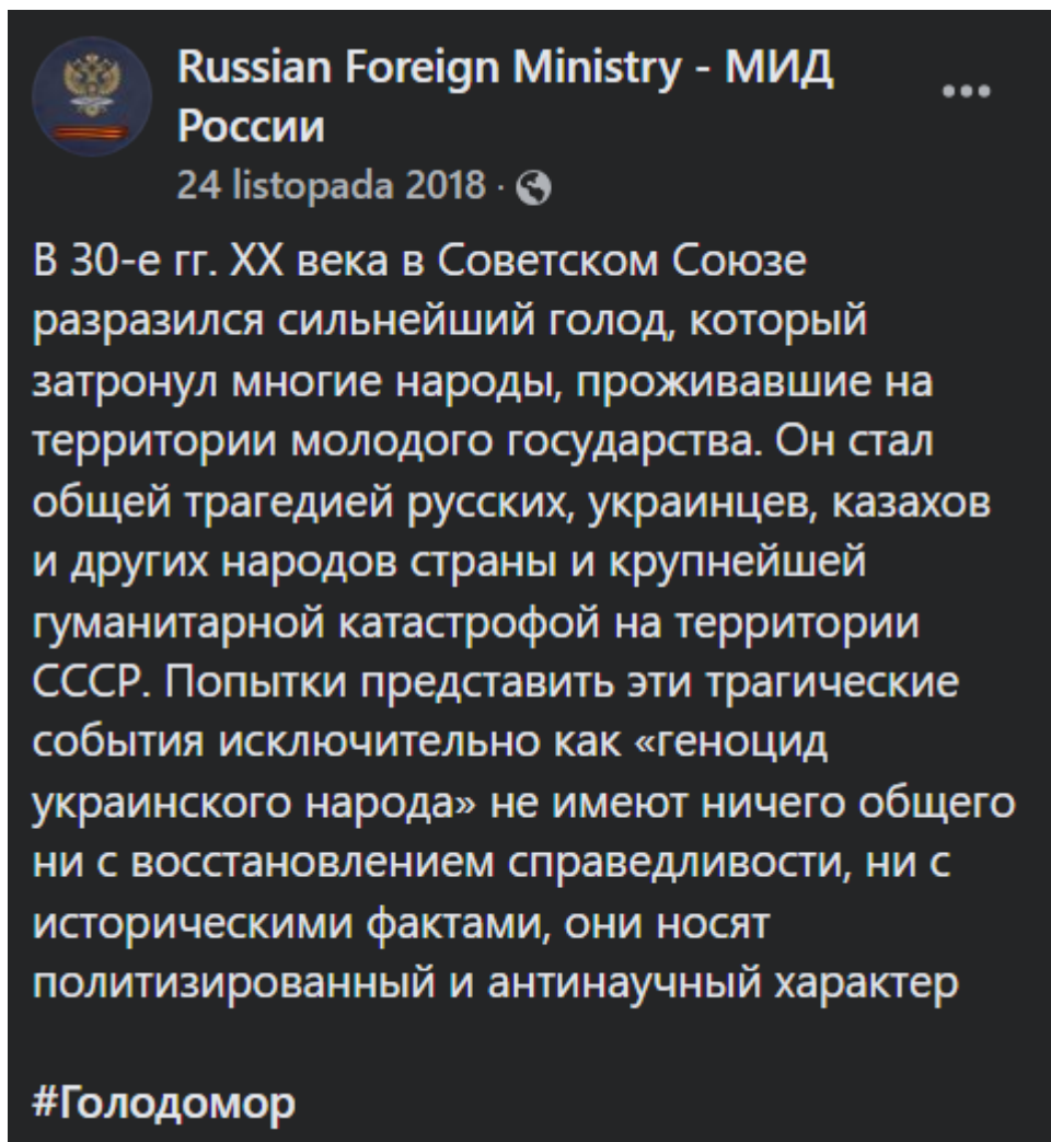
Obr. č. 4: Správa z 24. novembra 2018, ktorú vydalo Ministerstvo zahraničných vecí Ruskej federácie na svojom oficiálnom FB účte 9

V 30. rokoch 20. storočia vypukol v Sovietskom zväze krutý hladomor, ktorý postihol veľa ľudí, ktorí žili na území mladého štátu. Bola to spoločná tragédia pre Rusov, Ukrajincov, Kazachov a iné národy tejto krajiny a najväčšia humanitárna pohroma na území ZSSR. Pokusy prezentovať tieto tragické udalosti výlučne ako „genocídu na ukrajinskom národe“ nemajú nič spoločné s obnovením spravodlivosti alebo s historickými faktmi a vo svojej podstate sú spolitizované a nevedecké.