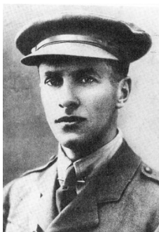
Obr. č. 2: