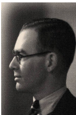
Obr. č. 1: