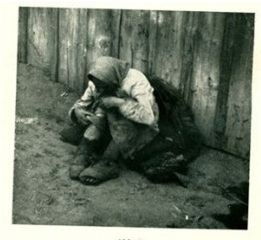
Ožobráčená žena z vidieka sedí pri plote v Charkove. iii

Vláda mohla zorganizovať úľavy a prijať pomoc zo zahraničia. Moskva však zahraničnú pomoc odmietla a tých, ktorí pomoc ponúkali, verejne odsúdila. Naopak, obilie z Ukrajiny aj iné druhy potravín sa ešte vyvážali do zahraničia za hotovosť. Na medzinárodnej úrovni sovietsky štát dôrazne odmietal, že je v krajine hladomor.