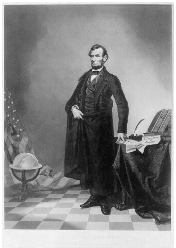
↑ Abraham Lincoln

Abraham Lincoln / gravat de William Pate, New York, William Pate, 58 & 60 Fulton St. (1865?) [accesat pe 5 decembrie 2020]. Accesibil la Biblioteca Congresului: https://www.loc.gov/pictures/item/2003654314/